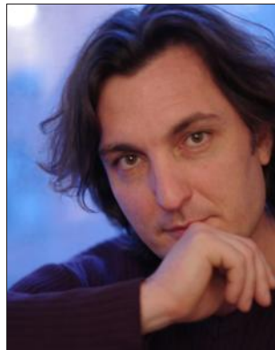
■ Ludovic Tézier.