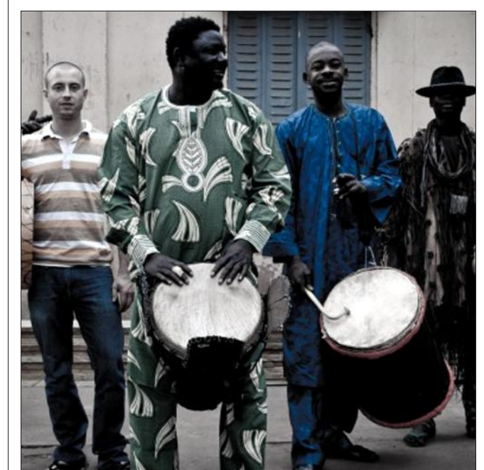
■ Bamako Quintet sera de la fête.