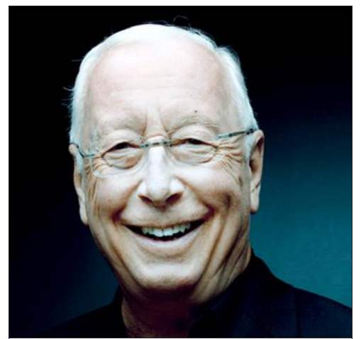
■ Une première pour William Christie.